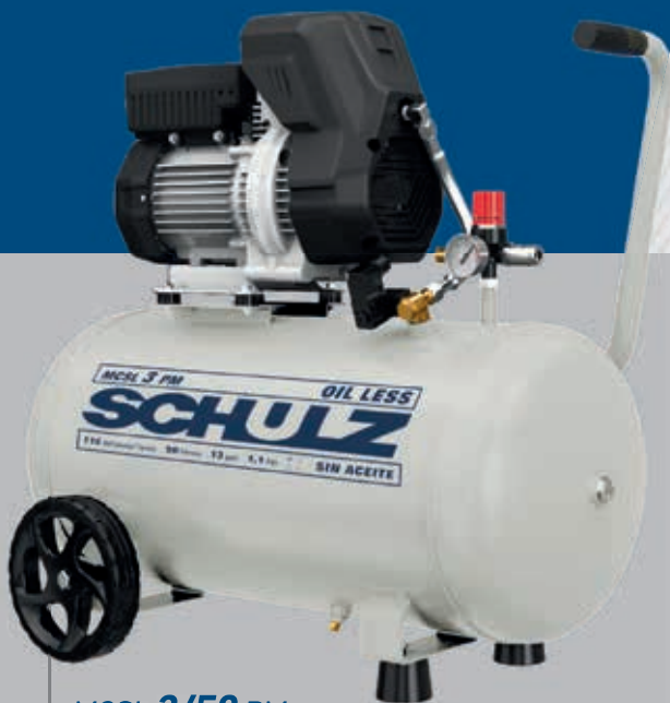
MCSL 3/50 PM

Compresores aptos para trabajar 24h al día