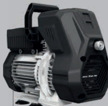
MCSL 3/AD PM