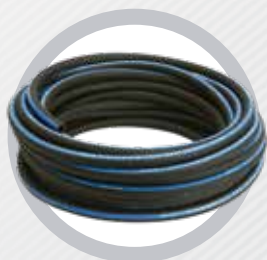
Mangueira para Ar Comprimido

5 m: 028.0395-0 10 m: 028.0399-0 15 m: 028.0396-0