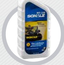
Óleo Lubrificante MS LUB 1 litro

5 m: 028.0395-0 10 m: 028.0399-0 15 m: 028.0396-0