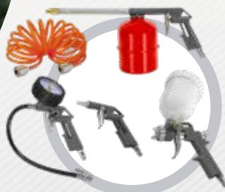
Air Kit 5 peças

Acessórios Schulz recomendados para você obter o melhor aproveitamento do seu compressor: