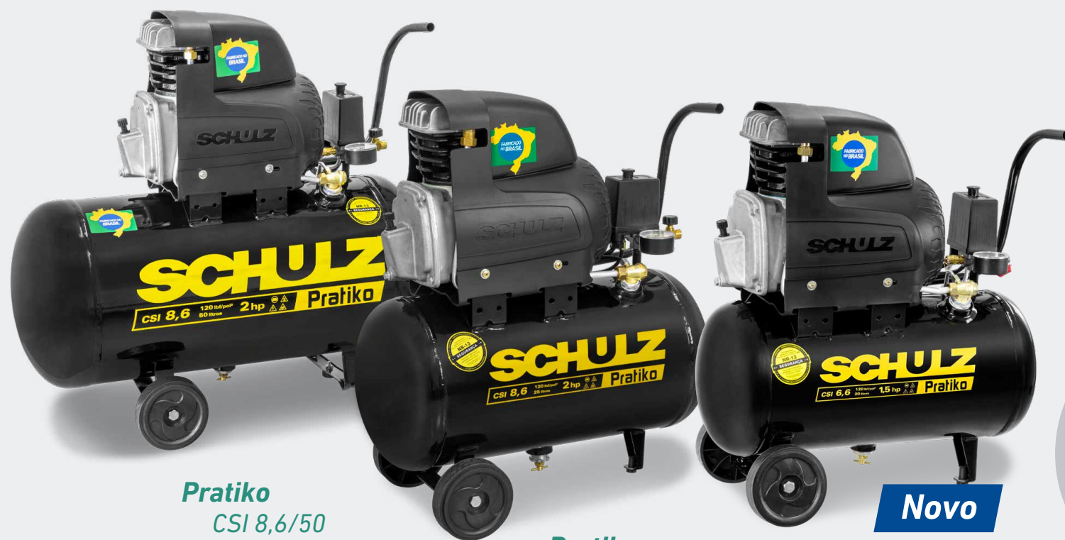
Pratiko CSI 8,6/50