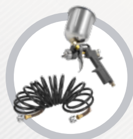
Compact Kit 3 peças