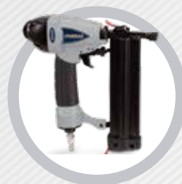
SPG 1850 Pinador e Grampeador