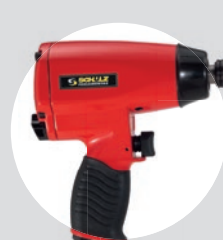
Chave de Impacto 1/2\"