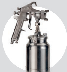
Pistola de Pintura Alta Pressão SPP AP02