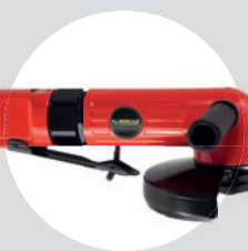
Esmerilhadeira Angular 5\" SFDC 11