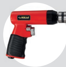
Furadeira 3/8\" Reversível SFFC 38