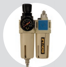
Filtro Regulador Lubrificador FRL