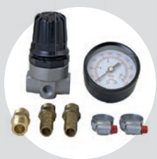
Regulador de Pressão e Manômetro

Acessórios recomendados para acompanhar o alto desempenho dos compressores da Série Especial 60 Anos Schulz: