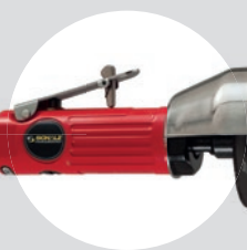
Serra de Corte 3\" SFPC 20