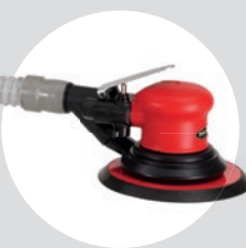
Lixadeira Roto Orbital 6\" SFLC 11