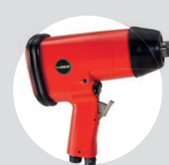
Chave de Impacto 3/4\"