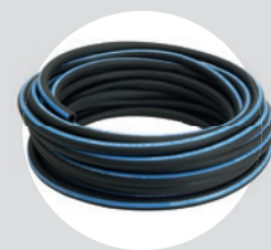
Mangueira PT 300 3/8\"