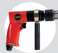
Furadeira 1/2\" Reversível SFFC 12