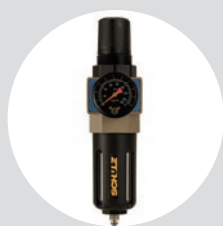
Filtro Regulador FR