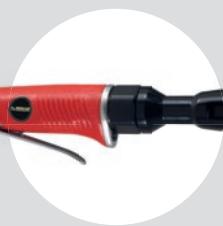
Chave de Catraca 1/2\" SFCC 70