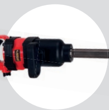
Chave de Impacto 1\" longa 8\" SFIC 2000L