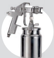
Pistola de Pintura SPP HVLP 02