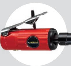
Mini Retífica Reta 1/4\" SFRC 25